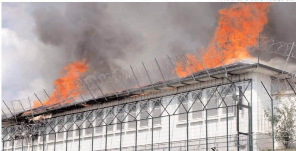
Beau comme une prison qui brûle

Mais il n'a aucune preuve. Les seuls éléments concrets sont des extraits de vidéosurveillance du CRA qui ne prouvent qu'une chose : que les accusés étaient bien enfermés au CRA de Vincennes le jour où il a cramé, au milieu de dizaines d'autres retenus essayant de se défendre contre les violences policières, et dont n'importe lequel aurait pu se retrouver à la place des accusés. Alors il charge la barque avec tout ce qu'il peut et il en rajoute en inventant une « complicité intellectuelle » et en les décrivant comme les membres d'une « bande constituée », de toute façon coupables d'être sans-papiers : « On ne rentre pas sans passeport dans un pays qui pourrait vous accueillir par ailleurs si les choses étaient faites régulièrement ». « C'est la loi ! » ; et peu importe si, pour faire les choses régulièrement, cette même loi exige d'accumuler pendant des années des preuves qu'on réside et travaille dans ce pays illégalement.