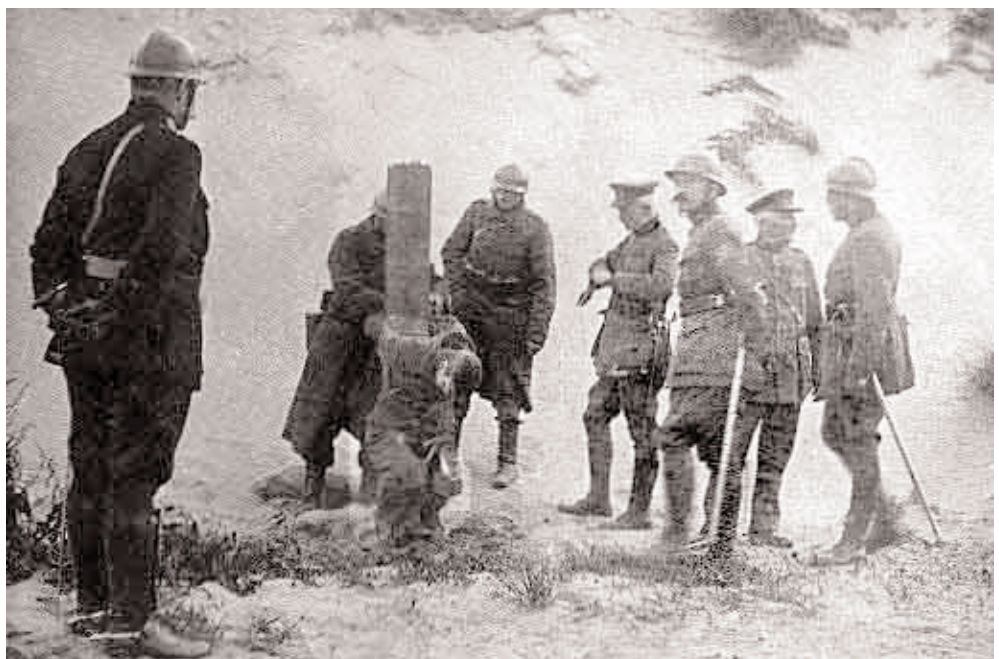
Exécution d'un mutin pendant la Grande Guerre