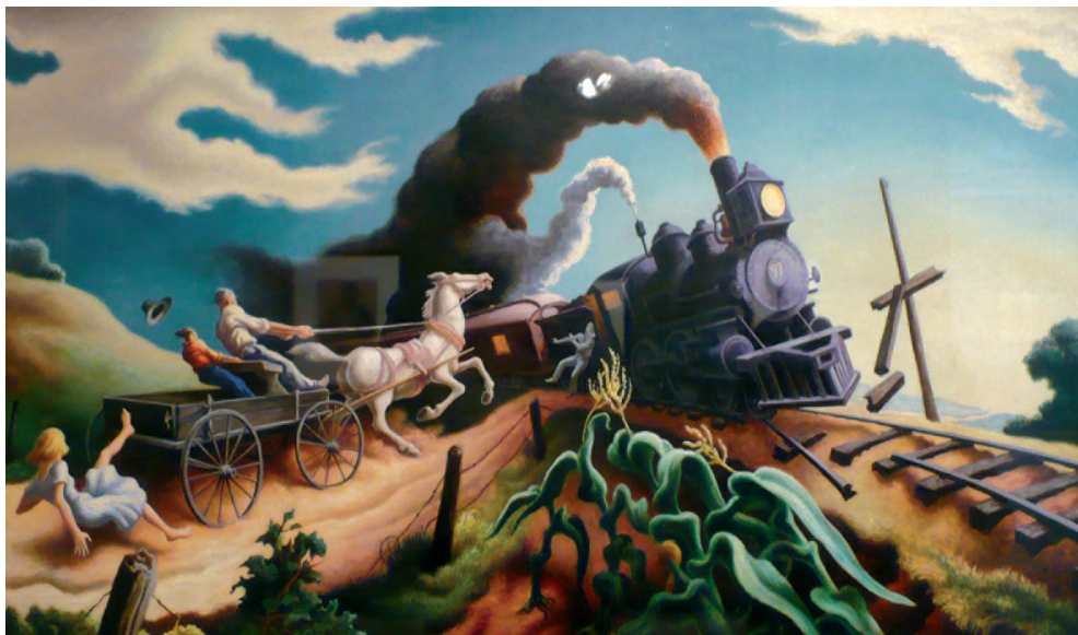
Wreck of the Old '97 de Thomas Hart Benton

PRIMAIRES SOCIALISTES, affrontements Mélenchon-Joly, la fille Le Pen en campagne (qui, à l'heure où j'écris ces lignes, additionne les vents et les lapins aux États-Unis), Hollande en une de Libé, le Front de gauche sur celle de L'Humain; bref, vous n'avez pas attendu ces quelques mots pour piger que le spectacle médiatico-politique a mis les bouchées doubles, et ce pour un bout de temps encore, élections présidentielles de 2012 obligent. Il n'y a pas grand-chose à en dire, tout n'étant qu'hypocrisie et manipulations, si ce n'est se demander – pour changer... – combien de temps tout ça va encore durer.