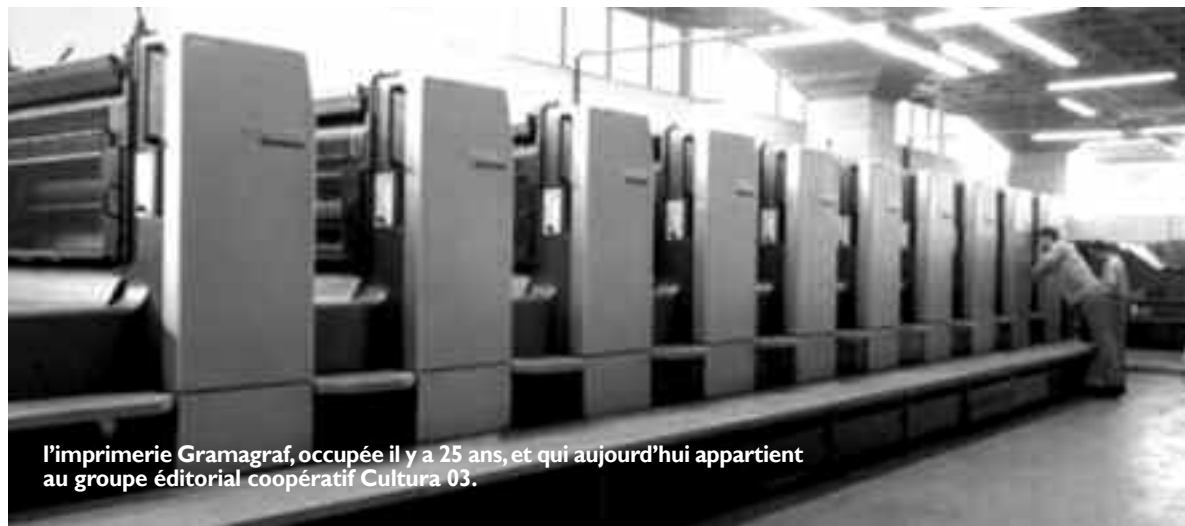
L'imprimerie Gramagraf, occupée il y a 25 ans, et qui aujourd'hui appartient au groupe éditorial coopératif Cultura 03.