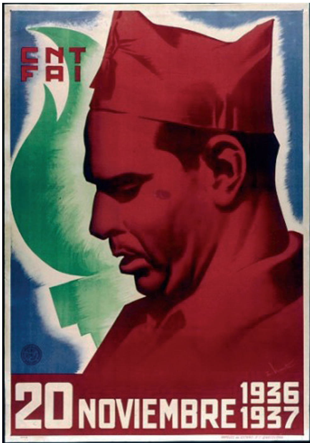
Affiche CNT-FAI en hommage à Durruti pour le premier anniversaire de sa mort, en 1937.

Ses paroles adressées à ses frères de classe avaient toute la valeur d'un testament révolutionnaire. Testament et non proclamation car il s'agissait, dans son cas, d'une mort