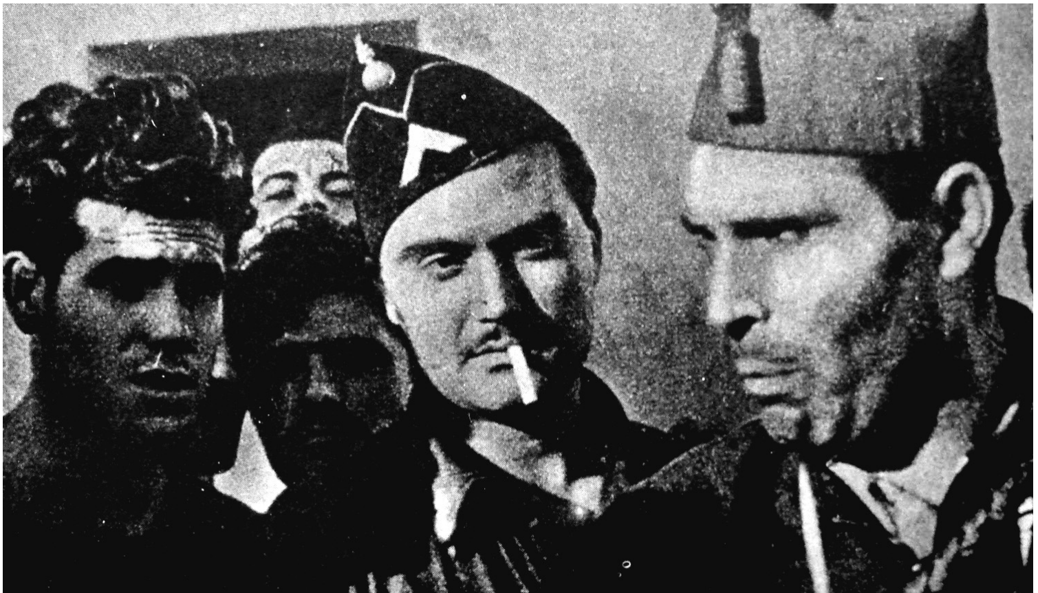
Buenaventura Durruti (à droite), en 1936.

cipline de caserne à laquelle elle opposait la supériorité de la discipline révolutionnaire : « Miliciens, oui ; soldats, jamais. »